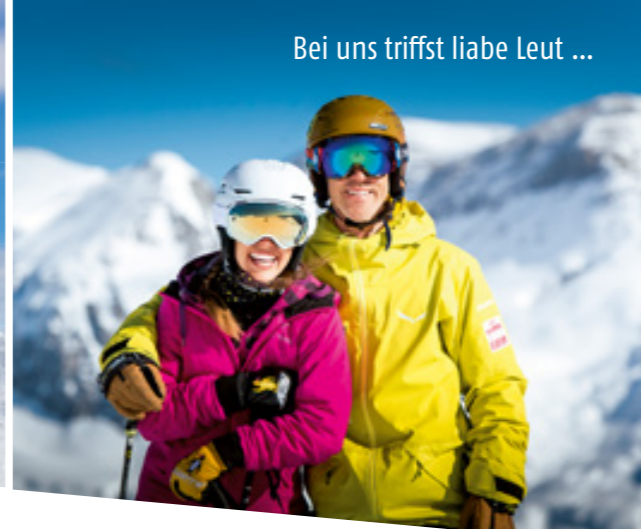
Bei uns trifft liebe Leut ...