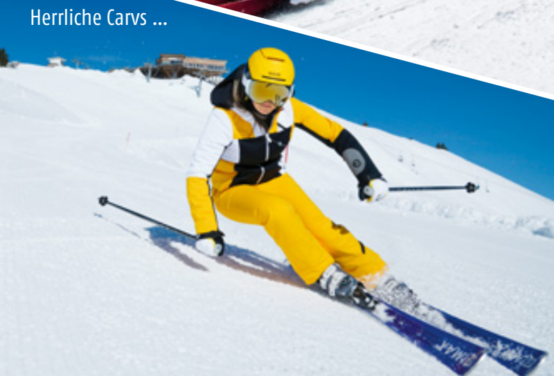
Herrliche Carvs ...