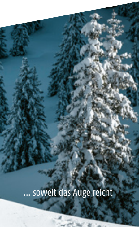
... soweit das Auge reicht

Kaiserau Tourismus GmbH Krumau 94, 8911 Admont +43 664 60353550, office@kaiserau.at facebook.com/kaiserau.tourismus www.kaiserau.at