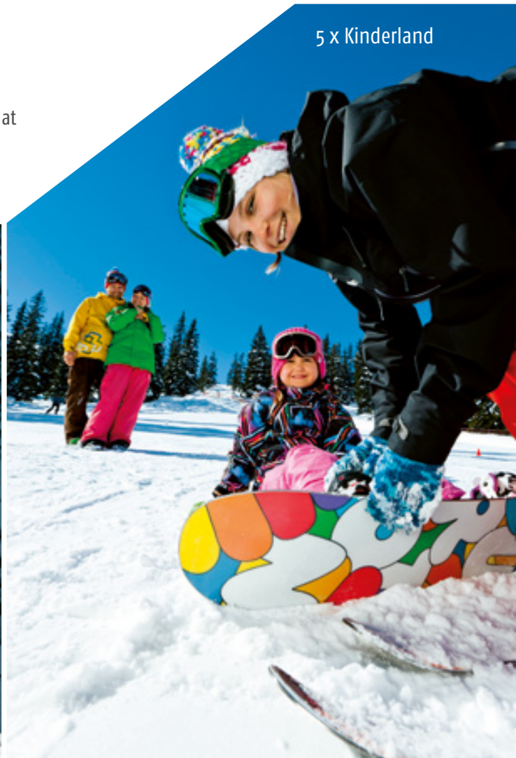
5 x Kinderland