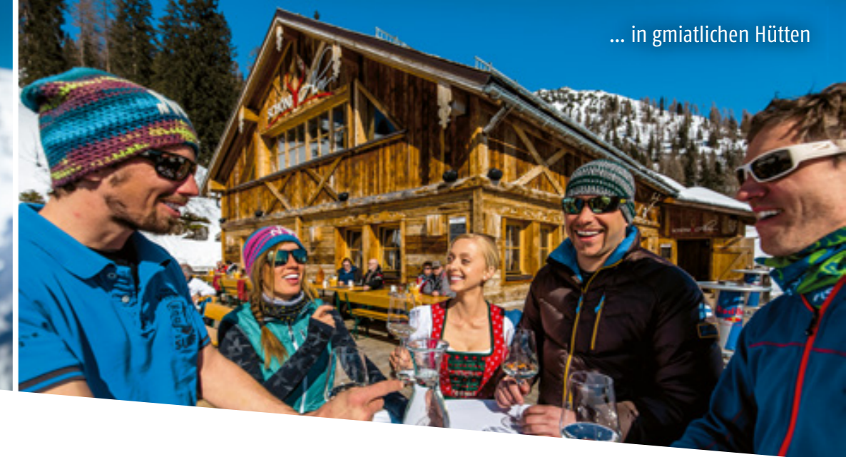
... in gemütlichen Hütten

Zur Abrundung des vielseitigen Angebotes wird auch eine Höhenlanglaufloipe über das idyllische Plateau geführt. Nach einem gelungenen Skitag lädt die großzügige Sonnenterrasse der Sportalm Kaiserau zum Verweilen bei bodenständigen Schmankerln ein.