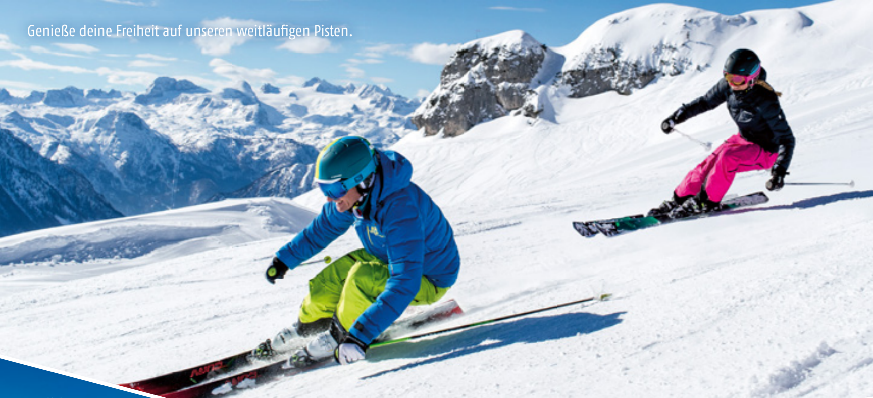
Genieße deine Freiheit auf unseren weitläufigen Pisten.